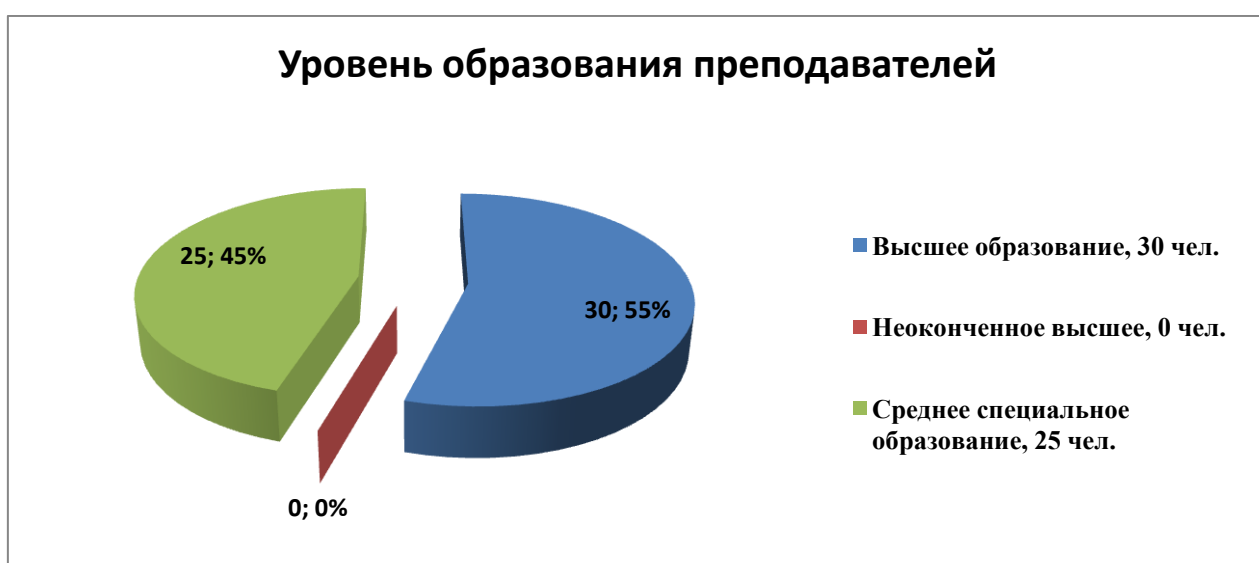
Рисунок 4 – Состав работников по уровню образования

Педагогический персонал (преподаватели) высокопрофессионален, большая часть педагогических работников (55%), как видно на рисунке 4, имеют высшее образование: