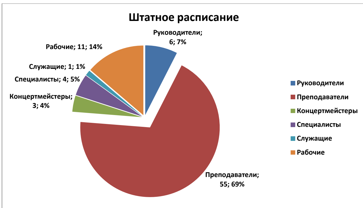
Рисунок 1 – Состав работников МБОУ ДОД «ДМШ №3»

(преподаватели, концертмейстеры). На рисунке 1 представлена диаграмма штатного расписания: