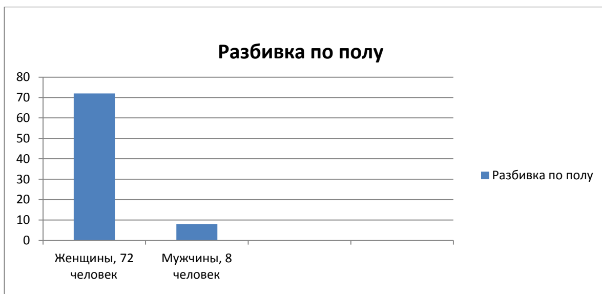
Рисунок 3 – Состав работников по полу

Административно-управленческий персонал представлен специалистами с высшим профессиональным образованием и высшей категорией аттестации по должности. Среди административно-управленческого персонала - два сотрудника пенсионного возраста (директор, и зам. директора по АХЧ), четыре – в возрасте от 35 до 50 лет (заместители директора по УР, УВР, НМР, главный бухгалтер).