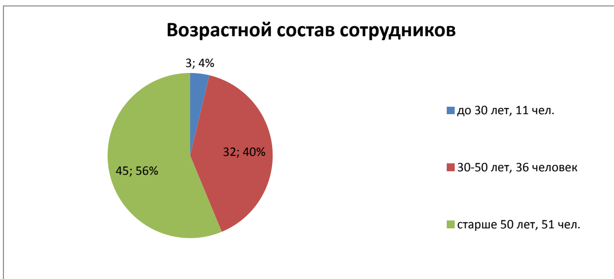
Рисунок 2 – Возрастной состав работников

На рисунке 2 представлена диаграмма возрастного состава сотрудников: